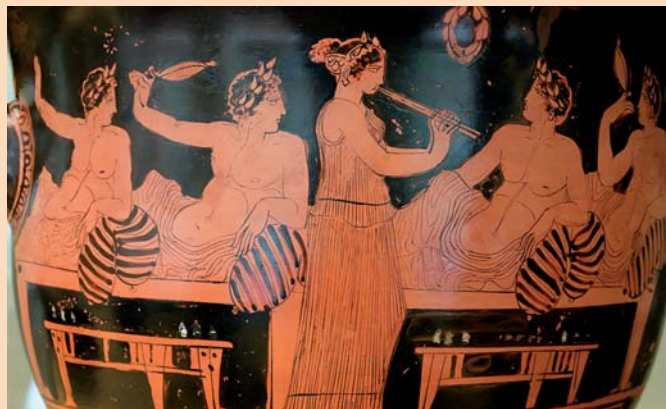
4 Kottabosspieler mit Aulosbläserin, um 420 v. Chr.

Die Ehefrauen aus Athen durften nicht an den Symposien teilnehmen. Dennoch mussten die Zecher nicht auf weibliche Begleitung verzichten: Hetären („Gefährtinnen“) waren bei den Gelagen mit von der Partie, Damen, die zwar ihre Dienste gegen Geld anboten, aber nicht ausschließlich der sexuellen Unterhaltung dienten. Sie tanzten, spielten auf der Flöte, plauderten, scherzten, waren schlagfertig und spielten Kottabos mit den anderen Gästen. Ferner besaßen einige Hetären Kenntnisse in Literatur, Kunst und Philosophie, die sie zu