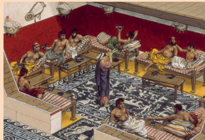
5 Symposion in Olynth, 4. Jh. v. Chr.

interessanten Gesprächspartnerinnen machten. Gleichwohl dürfte das Hetärentum für viele Frauen das unfreiwillige Los ihrer Leibeigenschaft oder leichtes und letztes Mittel gewesen sein, den Lebensunterhalt selbst zu verdienen.