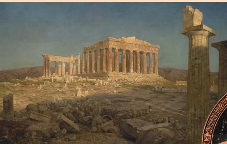
1 Frederic Edwin Church „The Parthenon“, 1871