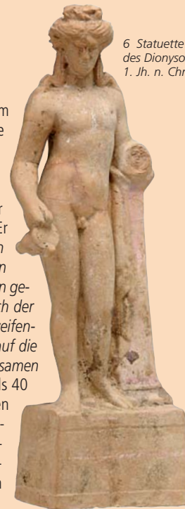
6 Statuette des Dionysos, 1. Jh. n. Chr.

Während des Symposions konnte man beim Wein seine Sorgen vergessen. Es gestattete die begrenzte Aufgabe der Selbstkontrolle. Allerdings galt es als äußerst peinlich, betrunken die Beherrschung über sich zu verlieren. Gelehrte wie Platon empfahlen daher eine langsame Annäherung an den Alkohol. Er meint, „dass die Kinder bis zum achtzehnten Lebensjahr überhaupt keinen Wein kosten sollen, ... danach mögen sie Wein mit Maßen genießen bis zum dreißigsten Jahr, nur soll sich der junge Mann des Rausches und des ausschweifenden Trinkens ganz enthalten; geht er aber auf die Vierzig zu, so soll er sich's bei den gemeinsamen Mahlzeiten wohl sein lassen ...“ Wer älter als 40 war, lief weniger Gefahr, sich noch einen krankhaften Umgang mit Alkohol anzuewöhnen als ein Jüngling, so dass Platons Ratsschlag sicherlich dazu beitragen konnte, einen verantwortungsvollen Umgang mit dem Wein zu erlernen.