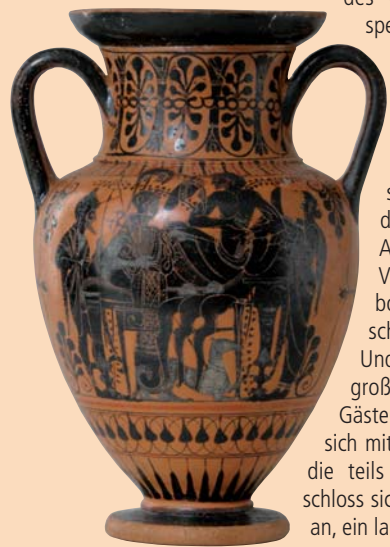
2 Herakles, Athena, Hermes und Apollon beim Gelage, um 530 v. Chr.

Das Symposion, das „gemeinsame Trinken“, war wichtiger Bestandteil des griechischen Alltags. Zunächst speisten die geladenen Gäste, ehe sie den Göttern Opfer darbrachten und damit das eigentliche Gelage einleiteten. Während die Symposiasten ihre Weinschalen leerten, amüsierten sie sich mit Rätseln oder bestimmten ein Thema, das diskutiert werden sollte. Der Abend hielt aber nicht nur geistige Vergnügungen bereit: Beim Kottabos etwa spielten die Zecher ein Geschicklichkeitsspiel mit dem Wein. Und auch die Sinnlichkeit spielte eine große Rolle: Entweder flirteten die Gäste miteinander oder sie vergnügten sich mit käufflichen Damen, den Hetären, die teils hohes Ansehen genossen. Oft schloss sich an das Gelage noch der Komos an, ein lauter Umzug durch die Gassen.