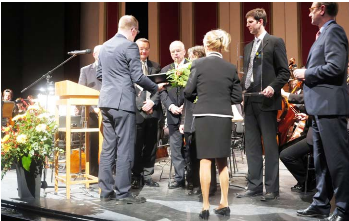
Die Verleihung des „Musikpreises der Stadt Duisburg in Verbindung mit der Köhler-Osbahr-Stiftung“

Angesichts der vielfältigen Aktivitäten über die Sinfoniekonzerte und Opern-