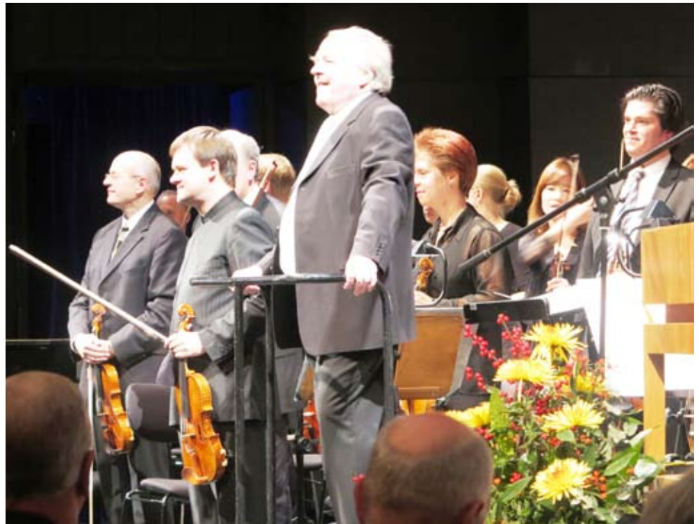
Gute und treue Freunde der Duisburger Philharmoniker: Frank Peter Zimmermann und Ex-Generalmusikdirektor Bruno Weil

Für den ehemaligen Generalmusikdirektor Bruno Weil und Duisburgs Star-Geiger Frank Peter Zimmermann war es eine Ehrensache, die kurzweilige Feierstunde musikalisch zu adeln. Bruno Weil mit einer schlanken,